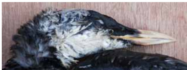
Volwassen zeekoet met opvallende geelwitte snavel ( Uria adamsii ) en sterk oranje gekleurde poten.