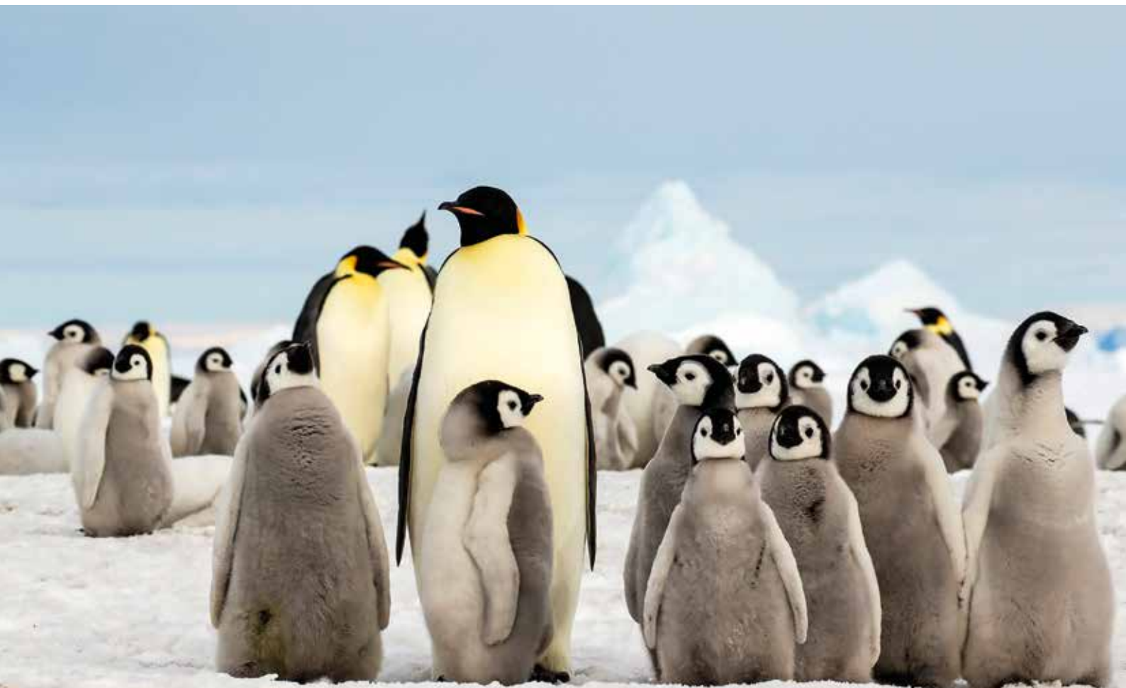
Keizerspinguïns op anderhalve meter dik zeeijs, Weddell Sea, Antarctica, 25 oktober 2018.